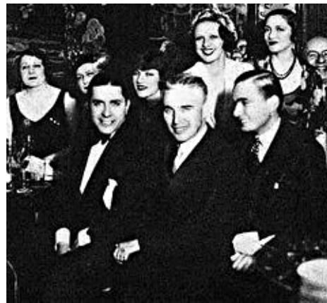
Гардель и Чарли Чаплин (в центре)

го на одну голову» страстно танцевали Аль Пачино в фильме «Запах женщины» (1992 г.) и Арнольд Шварценеггер в фильме «Правдивая ложь» (1994 г.). Эта мелодия звучит в кинокартинах «Плохой Санта» (2003 г.), «Вся королевская рать» (2006 г.), «Легкое поведение» (2008 г.). Эти творения киноискусства посмотрели миллионы, но мало кто из неискушенных зрителей представлял, что разрывавшее душу танго, которое звучало с экрана, сочинил и впервые исполнил Гардель в 1935 г.