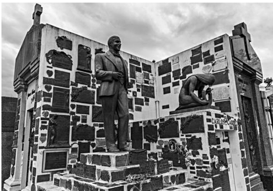
Могила Карлоса Гарделя на кладбище «La Chacarita» в Буэнос-Айресе

даны фонд и музей Карлоса Гарделя. Выпущены юбилейные почтовые марки с портретом певца и надписью «Бессмертный из Такуарембо».