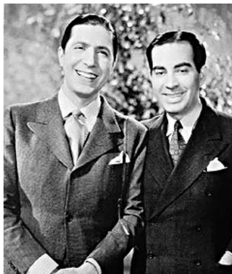
Гардель (слева) и Ле Пера, автор стихов танго

Однако певцу было важно подтвердить свой звездный титул во Франции. И ему это удастся с первого раза. В 1928 и 1929 гг. перед Гарделем открываются двери парижских «Le théâtre Fémina», «Le théâtre de l'Empire», знаменитого кабаре «Florida» на Монмартре, он выезжает на концерты в Канны и Монте-Карло. Гости из далекой латиноамериканской страны приглашают выступить на благотворительном балу в Парижской опере вместе с такими звездами артистической богемы, как Морис Шевалье и Джозефина Бейкер. Им аплодируют президент Франции Гастон Думерг и министры его кабинета, присутствующие на представлении. А пластинки, записанные Гарделем во Франции, расходятся огромными тиражами, что превзошло все ожидания. В письме, адресованном Раццано, артист называет «фантастическим» то, что только за первые три месяца в Париже проданы 60 тыс. его дис-