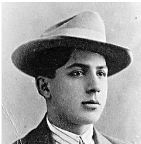
Карлос Гардель в 15-16 лет