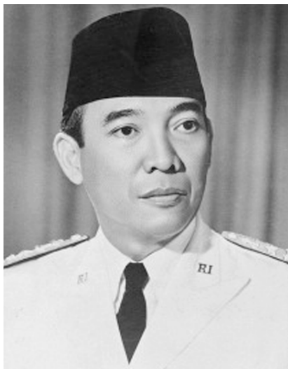
Первый президент независимой Индонезии Ахмед Сукарно.

непреодолимая ценность культуры, традиций и жизненной философии народов Индонезии и нации в целом.