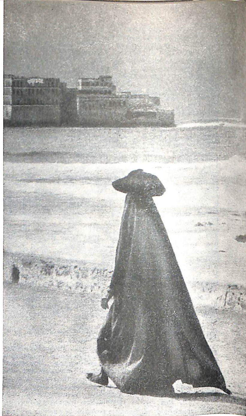
Облик этой кочевницы, бредущей по песчаному берегу Персидского залива, достаточно выразительно говорит о средневековых порядках, царящих в Саудовской Аравии.

словом, это была библейская «земля обетованная», «Арабия феликс» — «счастливая Аравия», как называли ее древние греки.